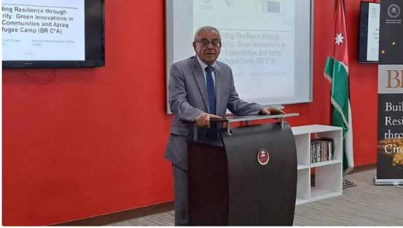
إطلاق مشروع "بناء القدرة على الصمود والتكيف البيئي" في الجامعة الهاشمية